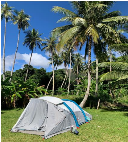
Camping unter Palmen