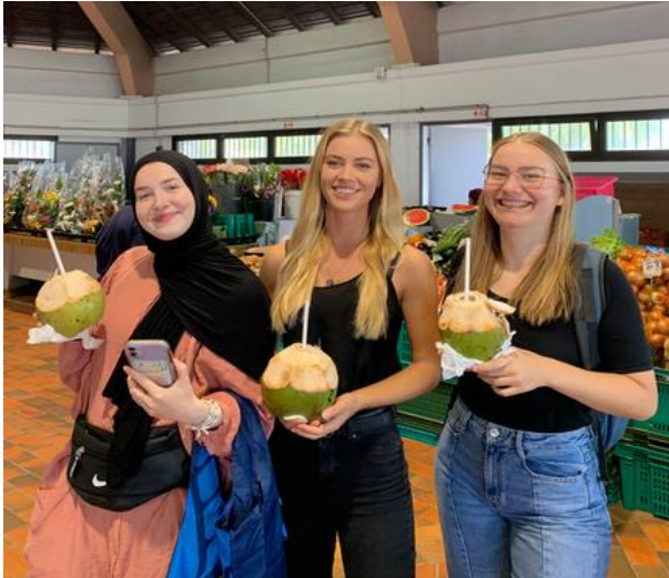
Frische Kokosnüsse vom Markt in der Stadt