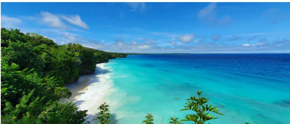
Strände auf der Insel Lifou