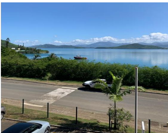
Der Ausblick aus einem der Vorlesungsräume