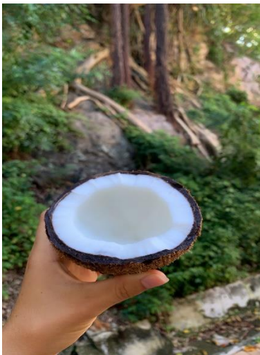
Eine von vielen Kokosnüssen, die wir am Straßenrand von den Palmen pflücken und im Wohnheim essen und trinken konnten.