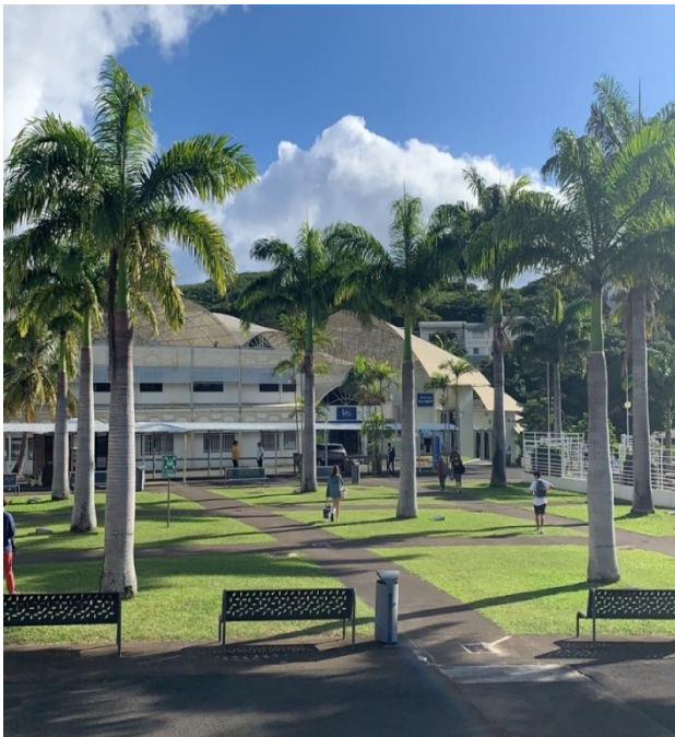
Der Uni Campus

Das Erasmus-Auslandsprogramm ist wirklich toll und ich bin sehr dankbar, dass ich die Möglichkeit hatte es wahrzunehmen.