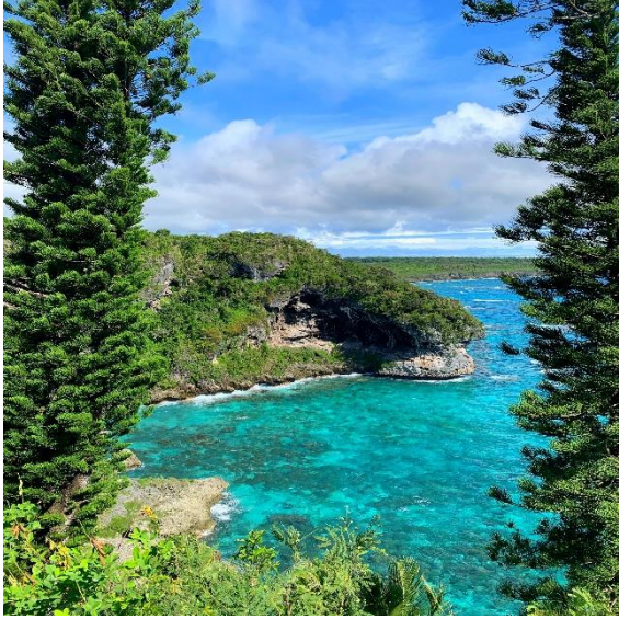
Aussichtspunkte auf der Insel Lifou