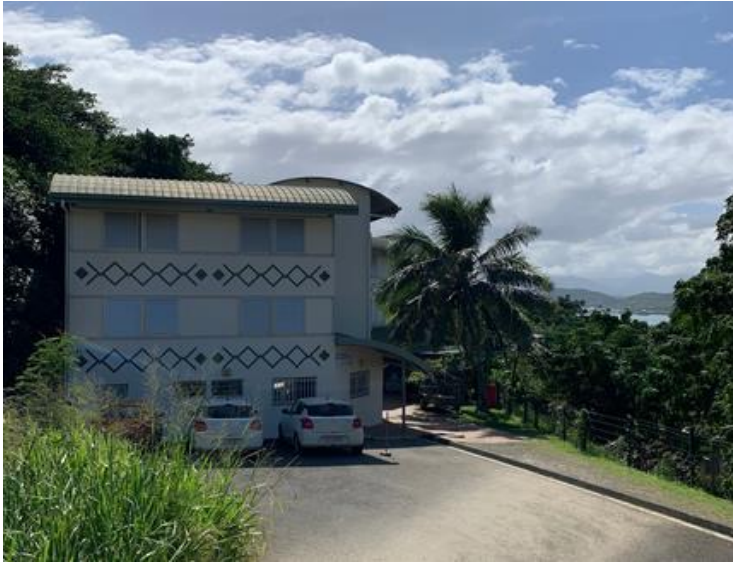
Die Residenz für die Austauschstudenten