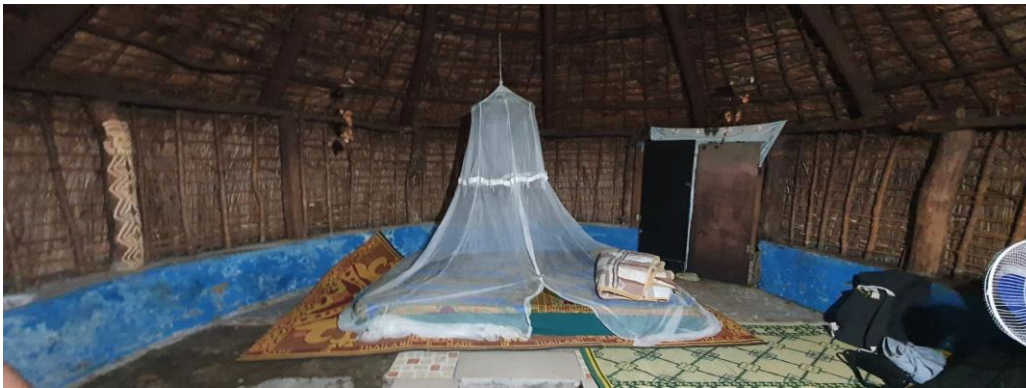
Übernachtung in einem traditionellen „Tribu“, dem Ureinwohnerstamm des Landes