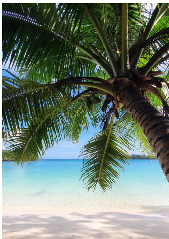
Strand auf der Insel Île des Pins