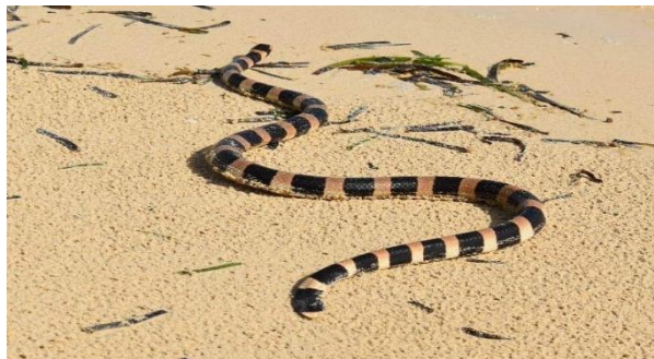
Neukaledonien: Heimat von vielen Lebewesen. Darunter auch Schildkröten und die giftige Wasserschlange, Tricot rayé . Diese ist jedoch so menschen scheu, dass es nie Zwischenfälle zwischen der Schlange und Menschen gibt.