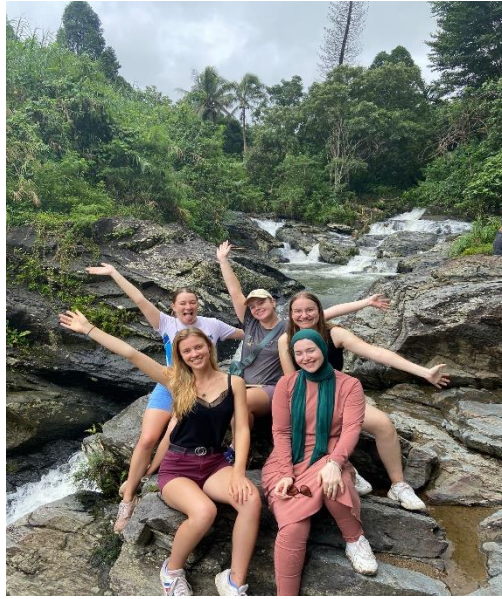
Weitere gemeinsame Unternehmungen