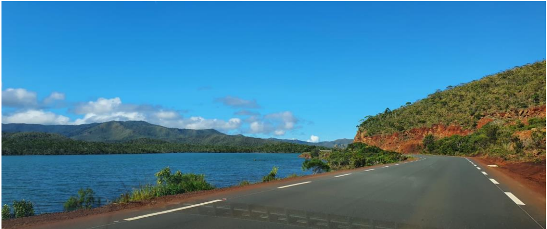
An der Ostküste der Hauptinsel Neukaledoniens (Grande Terre)