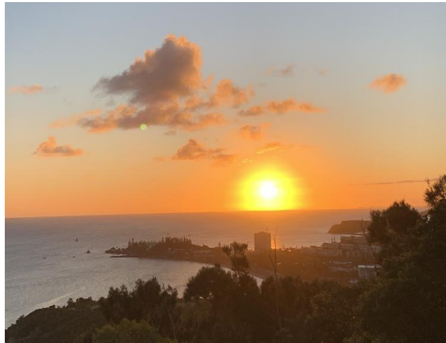
Sonnenuntergänge in der Hauptstadt, Nouméa