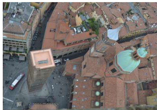
...und dann heißt es schon wieder „Ciao, Bologna!“