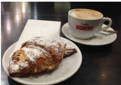
Ein letztes Mal Soja-Cappuccino und Cornetto

Mein Ziel in diesem Erasmus-Semester war vor allem das Verbessern meiner Sprachkenntnisse und das Eintauchen in eine neue Kultur. Ich würde sagen, dass ich beides geschafft habe; zurückgekommen bin ich aber auch noch mit ganz anderen Einsichten und Gefühlen. Gerade in Bologna gibt es viele politische Aktivist*innen und in den fünf Monaten, die ich dort verbracht habe, war einiges los. Bewegungen wie Fridays for Future und die der 6000 Sardinien haben mir gezeigt, dass viele junge Menschen europaweit für die gleichen Ziele auf die Straße gehen und sich eine andere Zukunft wünschen. Auch Italien hat zurzeit enorm mit dem Erstarken rechtspopulistischer Parteien zu kämpfen. Ob in Bremen oder Bologna - die Sprüche, Plakate und Forderungen auf den Demonstrationen sind ähnlich. In Bologna dabei zu sein und sich mit einem Meer demonstrierender Menschen solidarisch zu fühlen, hat dazu geführt, dass ich mich mehr denn je als Teil einer jungen europäischen Generation fühle.