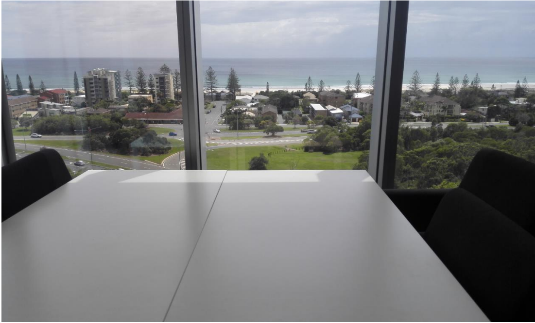
Ausblick aus dem 10. Stock von Gebäude B