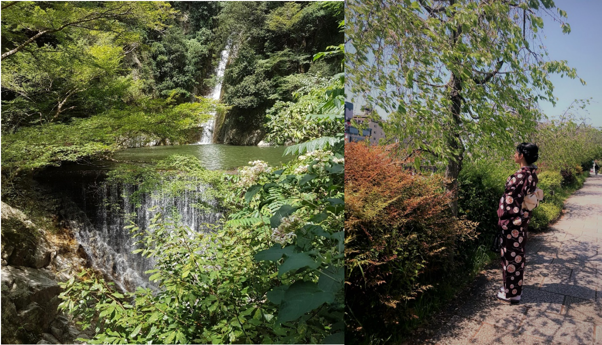
Wasserfall in Kobe