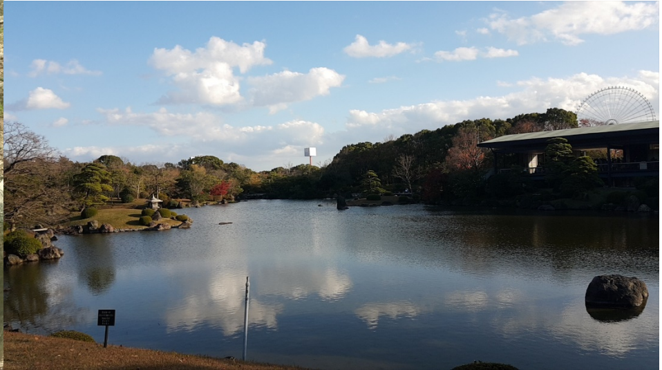
Expo-Park in Expositio