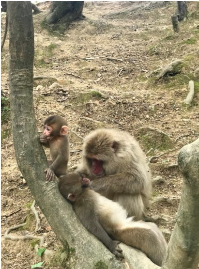
Monkeypark in Arashiyama