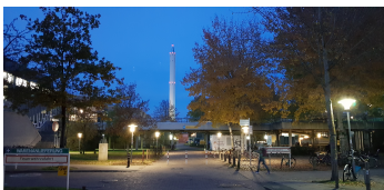
© Alumni der Universität Bremen e.V.