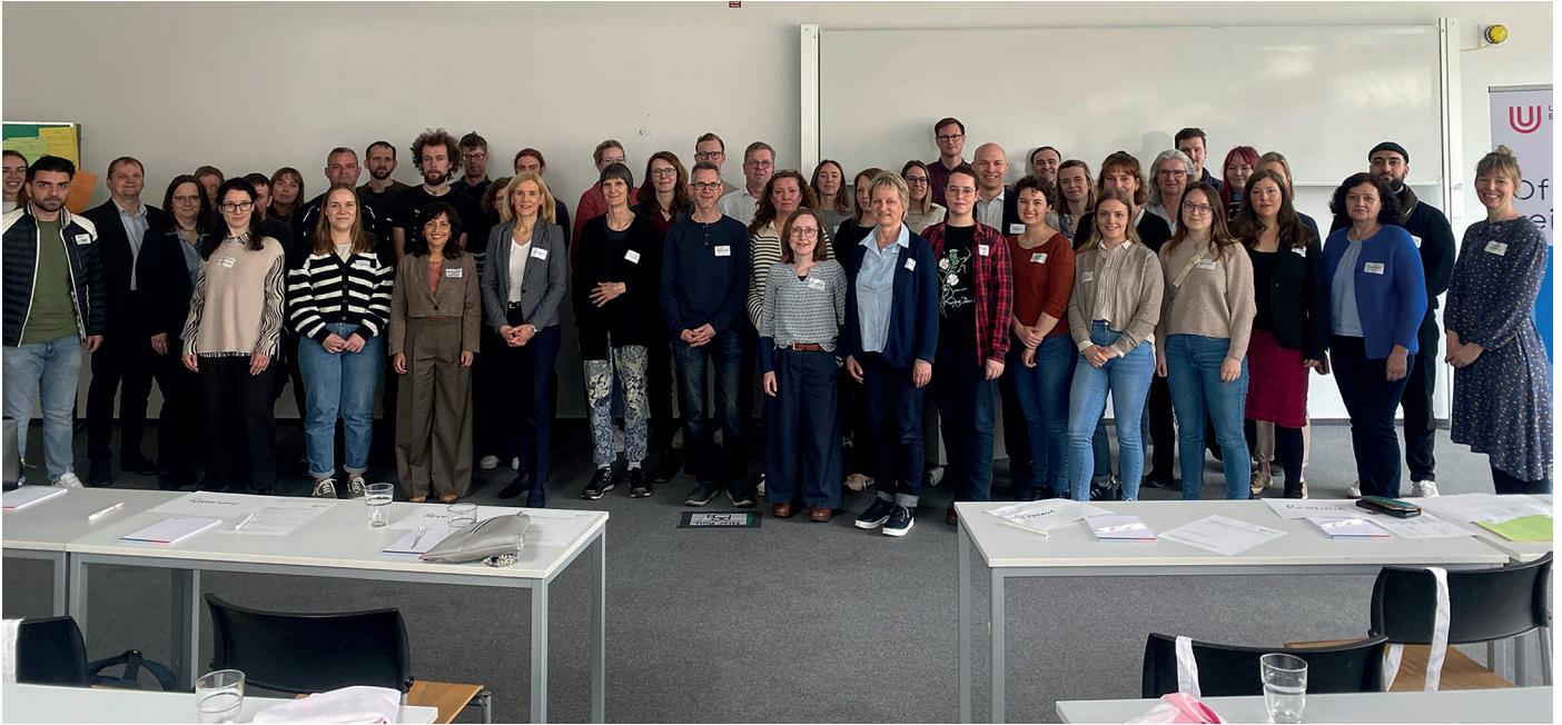
Teilnehmende des Begrüßungs-Workshops

Nach Begrüßung durch die Universitätsleitung und durch die: gewählten Interessenvertretungen (Personalrat, Frauen- und Gleichstellungsbeauftragte nach LGG, Zentrale Frauenbeauftragte nach BremHG, Schwerbehindertenvertretung und KRAM) wurde in dem neuen (nun im Auftrag der Universitätsleitung zentral organisierten) Format zunächst Raum für ein gegenseitiges Kennenlernen und Austausch in wechselnden Gruppen gegeben. Hier bewährte sich die Idee der gemeinsamen Veranstaltung für alle Beschäftigten auf jeden Fall: durch die Zufälligkeit der mehrfach neu gemischten Kleingruppen ergaben sich jeweils Gesprächspartner*innen aus ganz unterschiedlichen Tätigkeitsfeldern und Arbeitsbereichen. Von den meisten Teilnehmer*innen wurde dieser Austausch als interessant und bereichernd wahrgenommen.