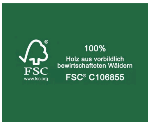
FSC Label (bei Produkten aus Holz)